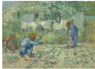
Vincent Van Gogh Primi Passi

La scuola di formazione socio-politica "POLITEIA" si accinge a svolgere le lezioni del sesto anno. Con il prossimo corso affronteremo un argomento nuovo ma di forte attualità: come passare dallo stato di malessere che pervade la società del XXI secolo e raggiungere uno stato di consapevole benessere. Per questo grande passo di maturità è essenziale il ruolo dell'educatore. Figura che nei Vangeli si trova impersonificata in Gesù: Gesù si pone chiaramente in atteggiamento di insegnamento e lo fa con assiduità, giorno dopo giorno; il suo insegnamento spalanca le finestre su un mondo di felicità reso possibile a tutti coloro che, fidandosi di Dio, si mettono al seguito di Gesù. Nel nostro piccolo e quotidiano vivere siamo chiamati a svolgere continuamente e quotidianamente la funzione di educatore: in primis come genitori, professori, responsabili dell'oratorio. Ma si può anche affermare che ci coinvolge tutti: ciascuno di noi è educatore di se stesso e del vicino più prossimo con la finalità di stare bene e passare da uno stato di malessere a quello di benessere. Per raggiungere questo obiettivo ci avvarremo della qualificata collaborazione dei docenti dell'Istituto di Psicologia dell'Educazione dell'Università Pontificia Salesiana di Roma.